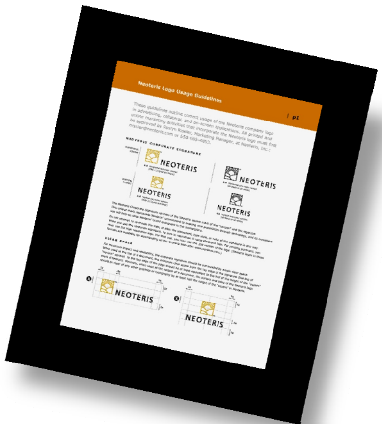
En side fra en designmanual, der forklarer om korrekt brug af virksomhedens logo.

Faget afsluttes med, at du skal lave en hel "grafisk identitet" for en virksomhed – det vil sige designe logo, brevpapir, skilte, annoncer, emballage, reklameartikler og alle de andre ting, der til sammen giver virksomheden et markant og genkendeligt visuelt image. Retningslinjerne for den visuelle identitet samles i en såkaldt designmanual, der udgør en slags design-bibel for virksomheden