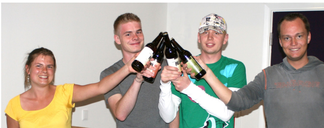
Vindergruppen fra specialeugen om Randers Bryghus blev selvfølgelig belønnet med store flasker Randers-øl.