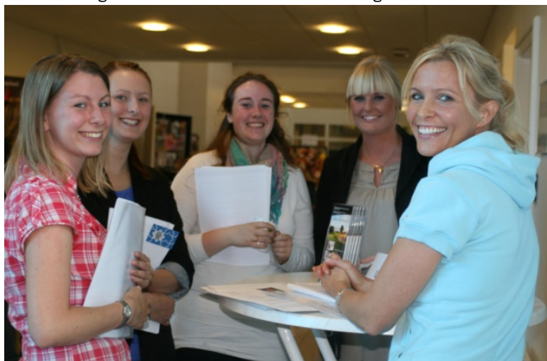
Studerende og virksomheder mødes til Praktik-dating

I bedste speed-dating-stil cirkulerer studerende fra akademiets markedsføringsøkonomuddannelse rundt mellem caféborde, hvor